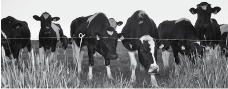
Het project ZoZietLimburgDieren wordt op maandag 11 maart toegelicht.