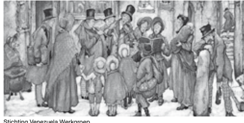
Stichting Venezuela Werkgroep

Op deze markt verkopen wij prachtige bloemstukken. Verschillende oude koffie serviezen, rieten manden, rieten fietsmanden, oude schilderen, snuistieren, beeldjes, glaswerk, prachtige gehaakte kerstballen, enz. En natuurlijk onze enveloppen loterij met bijna altijd prijs. Grote loterij met als hoofdprize levensmiddelen mand geschenken door Phicoop Ospel. Maar vooral gezelligheid. Met een lekker kop koffie en onze welbekende zelfgebakken vlaai of wafel. Tot zondag 11 november