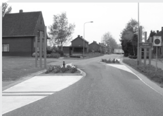
Een dorpsraad behartigt de belangen van bewoners in een kern.

De participatie van burgers staat hoog in het vaandel van de gemeente en het gemeentebestuur weet graag wat er leeft onder haar inwoners. Daarom is er veel aandacht voor het betrekken van burgers bij het bestuur van de gemeente. De verschillende dorpsraden in de gemeente Nederweert vervullen een belangrijke rol in dit proces. Maar u kunt ook gebruik-