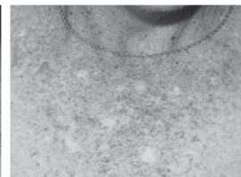
Zonneshade op het decolleté.