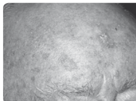
Zonneshade op de schedel.

Zonneshade is een aandoening die artsen actinische keratose noemen en die ontstaat na jaren blootstelling aan UV-straling. Deze plekken komen vaak voor op zichtbare huiddelen, zoals het gezicht, decolleté, het (kalende) hoofd, oren, nek, armen en handen. Zonneshade is vaak eerder te voelen dan te zien. De huid is verdikt en voelt wat ruwer aan dan de gezonde huid. Er zit een korstachtig laagje op, dat aanvoelt als schuurpapier. Zonneshade kan een beetje pijnlijk aanvoelen en plekken bloeden snel als het korstje eraf gekrabbd wordt. Doorgaans zijn ze kleiner dan 1 cm maar kunnen wel enkele centimeters groot worden. Zonneshade is niet besmettelijk. Meestal is de kleur van de zonneshade plekken anders dan de gezonde huid. Er zijn verschillende soorten zonneshade, sommige zijn vlak, andere verhoogd in de vorm van een bultje of torentje.