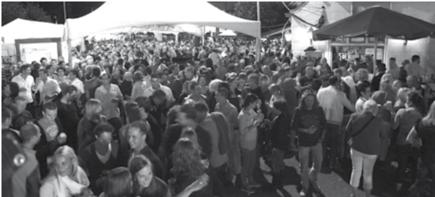
De Algemene Plaatselijke Verordening voorziet o.a. in regels rond evenementen, zoals de kermis