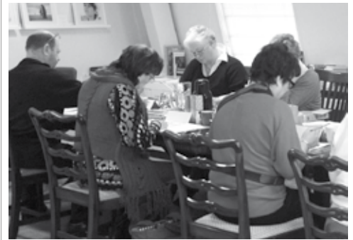
Deelnemers aan de Schrijflounge aan het werk