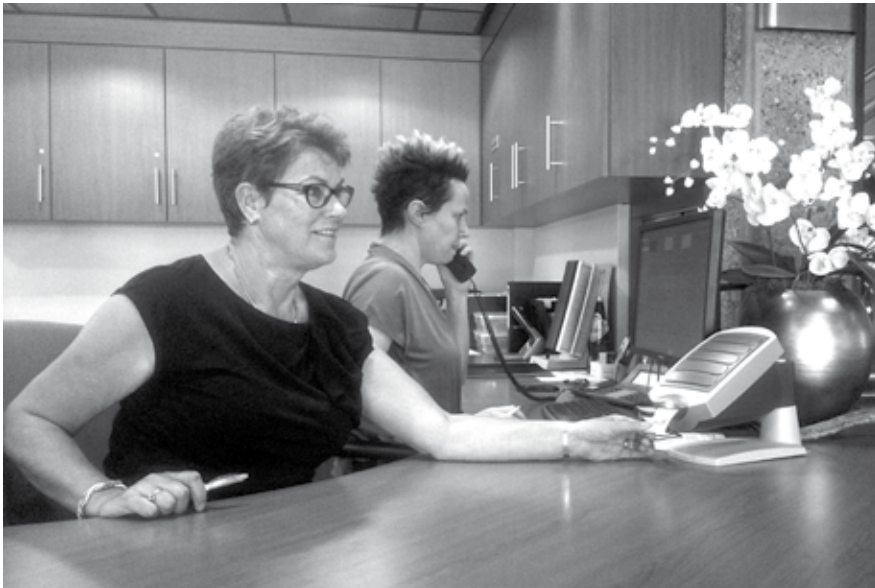
Vanaf maandag 4 augustus kunt u bij ons voor veel diensten een afspraak maken. Zo voorkomt u dat u moet wachten.