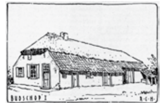
Tekening van een oude boerderij uit Budshop. Langs de rechterzijde is de dakoversteek zonder dakgoot te zien. Dit is de 'Euzendrop'.

De feestdag van 'Pis Greet' is een zogenaamde Merkeldag of Lotdag. Dit wil zeggen dat het weer op zo'n dag bepalend werd geacht voor het weer in de periode erna. Geen wonder dat zo'n Merkeldag omgeven werd door weerspreuken. Zo ook Sint Margriet, waarvan in Nederweert diverse weerspreuken gangbaar waren, zoals: "Es 't druueg op Pis Greet, dan raengelt 't 40 dage neet", "Margaretha's raengel bringt