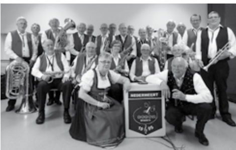
De coconblazers goed voor een kleurrijk stuk muziek.

Op zondag 13 juli maken de coconblazers weer muziek op Eynderhoof. Deze keer zijn er ook diverse bloemenwekers en bloemisten uit de regio aanwezig die zorgen voor een kleurrijk bloemenfestijn. Dit alles afgewisseld met een al even kleurrijk stuk blaasmuziek, enkele zangnummers en de geur van de Bakkerij maakt u dag compleet. Geniet op het terras van de zelfgebakken lekkernijen en of een goed glas bier. Bezoek de oude ambachten in vol bedrijf en de gezellige drukte. Altijd al eens naar Eynderhoof willen komen? - al les op u gemak bekijken en genieten van de vrolijke tonen van de Coconblazers? Kom dan op zondag 13 juli naar Eynderhoof, De blaaskapel, "de coconblazers" speelt er van 14.00 uur tot 17.00 uur en brengt leuke goed in gehoor liggende blaasmuziek waarvan u zeker enkele stukjes zult herkennen uit vroeger tijd. U bent van harte welkom 13 juli 2014 in Eynderhoof en mocht u verhinderd zijn? Op zondag 20 juli spelen ze op het Munsterplein in Roermond, op 3 augustus in de Ospelse Peel en op donderdag 14 augustus op de Markt in Weert.