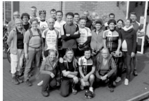
Alle deelnemers aan de 111 trap en 20 stap van het Toon Hermans Huis Weert.