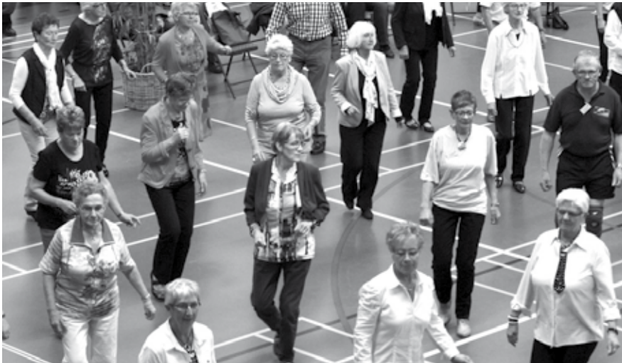
Nederweert investeert al langer in het bevorderen van de eigen kracht, bijvoorbeeld tijdens Nederweert Vitaal.