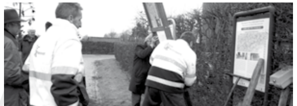
Wethouder Houtman plaatst met hulp van de buitendienst het eerste informatiepaneel bij Openluchtmuseum Eynderhoof.

Routes uitgestippeld met werkgroepen uit elke kern