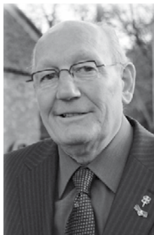
Bestuur en vrijwilligers Openlucht-museum Eynderhoof