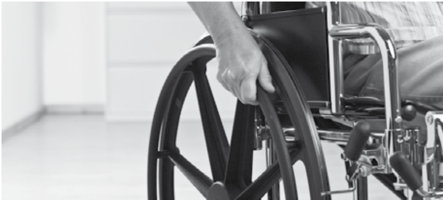
Eén op de zes inwoners van de provincie Limburg heeft vorig jaar met discriminatie te maken gehad, o.a. vanwege een handicap.