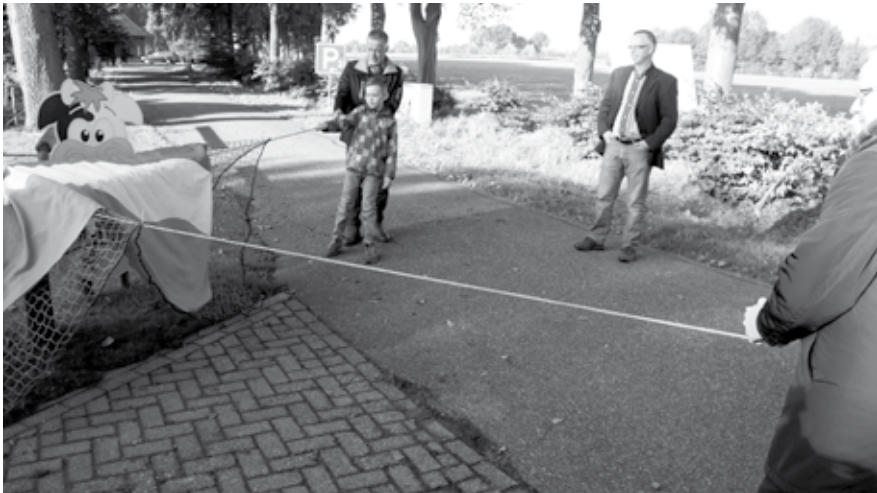
In oktober vorig jaar werd de eerste knooppuntpaal bij Usboerderij Gommers feestelijk onthuld.