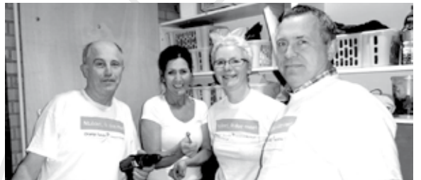
Bij de Reddingsbrigade werden de opbergruimten opgeknapt.

Wat is er weer veel vrijwilligerswerk verzet in Nederweert!