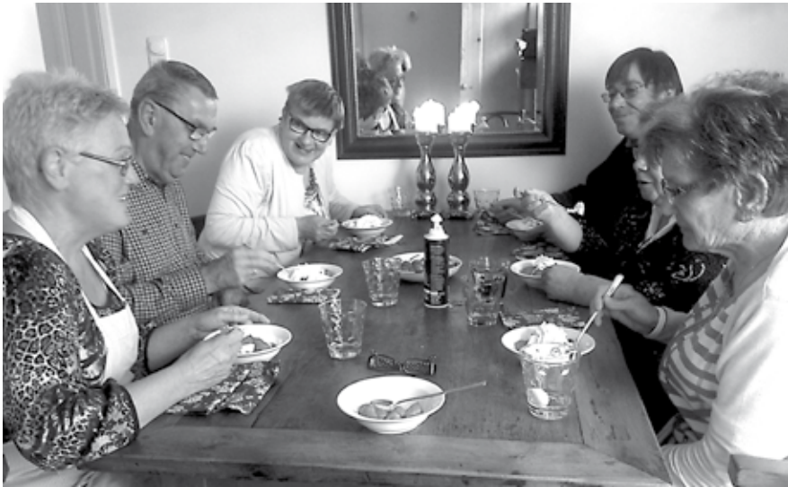
Samen in gesprek. In alle kernen van onze gemeente is binnenkort een eetpunt waar inwoners elkaar kunnen ontmoeten.