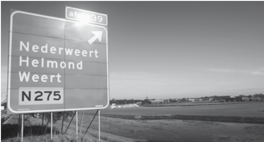
Steeds meer bedrijven weten de weg naar Nederweert te vinden.