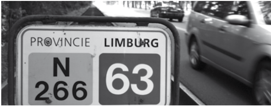
Het verleggen van de huidige N266 heeft een prijs, niet alleen in geld, maar biedt kansen die te waardevol zijn om te laten liggen.