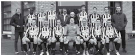
Merefeldia 5: Clauwers-Linders Distributie