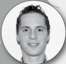
8. Stefan Verstappen