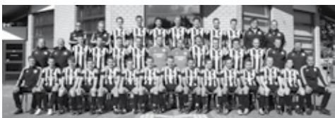
Merefeldia Selectie: Topfysiotherapie Knapen en Orthopedie Weert