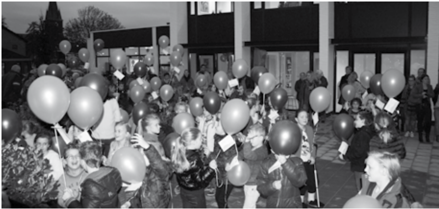
Nog even wachten en dan mogen de ballonnen de lucht in...