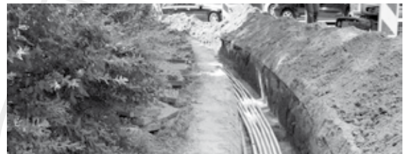
Over de aanleg van glasvezel in het buitengebied werd uitvoerig gesproken.

De gemeenteraad heeft op dinsdag 3 november de begroting vastgesteld. Er werd extra aandacht gevraagd voor de balans tussen vraag en aanbod van woningen. Daarnaast stemde de raad in met het beschikbaarstellen van krediet om de haalbaarheid van de aanleg van glasvezel in het buitengebied te onderzoeken.