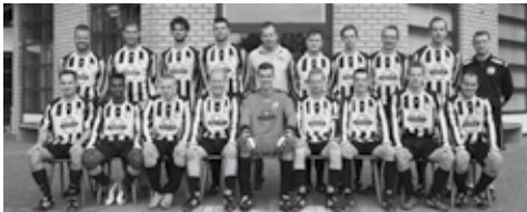
Merefeldia 4: Pins & Pints Bowling