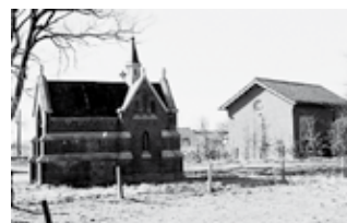
De Antoniuskapel van Rosveld en het waterpompestation op de plaats van de voormalige kluis.