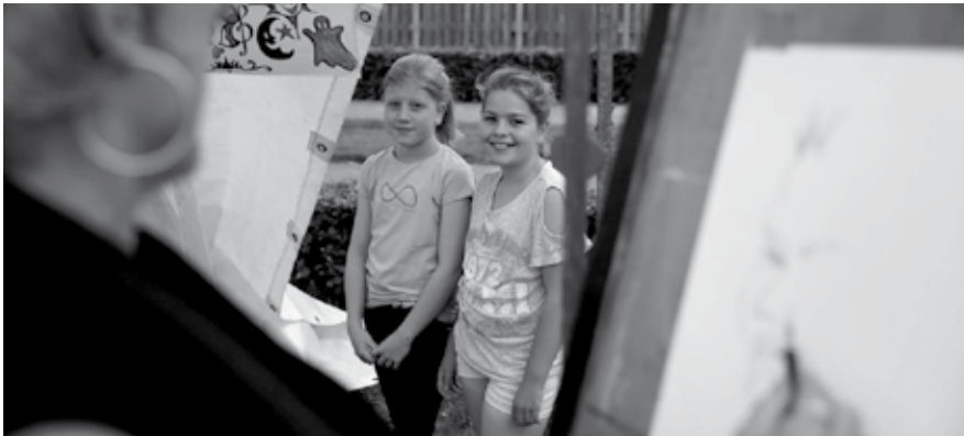
Hart voor je Wijk Nederweert-West werd vorig jaar afgesloten met een gezellig eindevenement. Met veel aandacht voor kunst uiteraard!