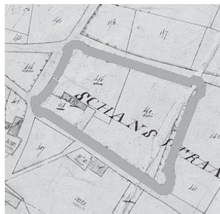
Plattegrond van de Kreijelerschans, gelegen aan de Hoofstraat (kadasterkaart uit 1844).

De oorsprong van de Nederweertse schansen ligt rond 1635. Uit die jaren dateren de oudste vermeldingen in de archieven. Die periode correspondeert met de nadagen van de Tachtigjarige Oorlog, toen de regio rond Nederweert wisselend Hollands en Spaans was en doorlopend geteisterd werd door onderbetaalde en muitende krijgstroepen. Het beheer van de schans was belegd bij een tweetal schansmeesters. Van de Kreijelerschans is het schansreglement bewaard ge-