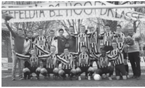
Merfeldia B1 is met een voorsprong van dertien punten ongeslagen kampioen geworden in de hoofdklasse J. Hierdoor promoveert het team naar de vierde divisie.