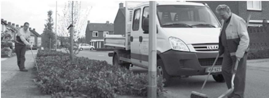
We pakken door op het parcours van 'doen' naar 'zorgen dat'. Zo gaan we bijvoorbeeld met u in overleg om samen te bepalen waar groenonderhoud nodig is en waar het wat minder mag.