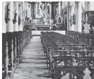
De banken en zitbanken in de St. Lambertuskerk. Oude ansichtkaart van omstreeks 1930 (detail).

De voorste kerkbank aan de zuid- of epistelzijde (in Nederweert de 'vrullie-kanti' genaamd) was gereserveerd voor de dienstmaagden van de pastoor en de drie kapelaans. Als bijvoorbeeld de huishoudster van een van de kapelaans eerder in de kerk arriveerde dan die van de pastoor, dan moest zij een plekje naar rechts schuiven omdat de pastoor een hogere rang had dan de kapelaan. Ook de