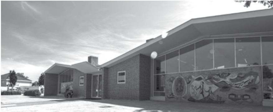
Met deze ombouw van basisschool De Tweesprong blijft een markant stuk erfgoed behouden voor de gemeente.