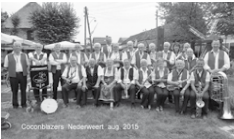
De coconblazers laten u proeven van een goed stuk muziek

Op zondag 7 augustus, maken de Coconblazers weer muziek op Eynderhoof. Op deze dag staat het hele museum in het teken van smaak en "proeven". U kunt kennis maken en tevens proeven van al het heerlijks uit onze regio.