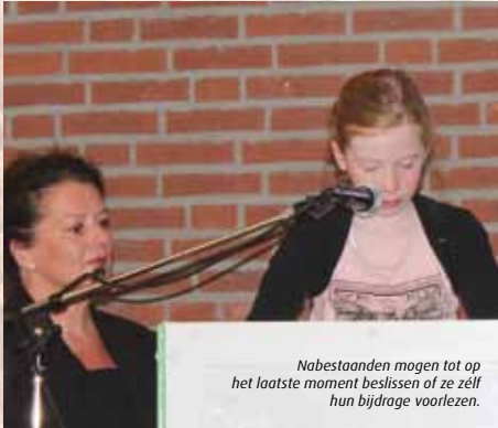
Nabestaanden mogen tot op het laatste moment beslissen of ze zélf hun bijdrage voorlezen.