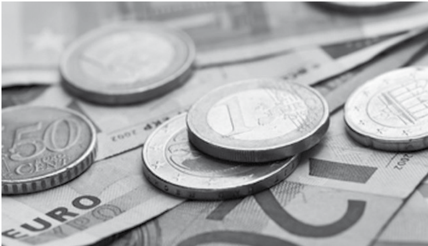
Sober en doelmatig omgaan met de beschikbaar gestelde middelen gaat hand in hand met een gezonde begroting voor Nederweert.