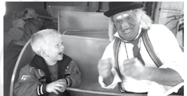
Ook Clown Desalles is er weer bij.

Bijna kermis. De leden van het comité Kermis d'Ind-j en de exploitanten hebben samen weer gezorgd voor leuke attracties en gezellige muziek. Op vrijdag 2 juni om 17.00 uur is de opening.