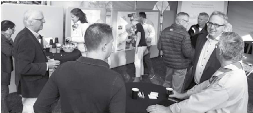
Vorig jaar konden belangstellenden al een beeld krijgen van de kansen die de Kanaalzone biedt tijdens een aantal bijeenkomsten op locatie.