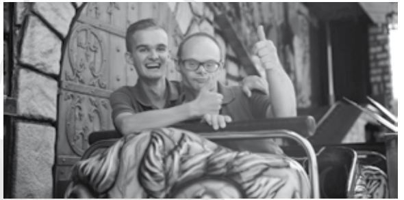
Vorig jaar genoten bewoners van PSW op de prikkelarme kermis.

De jaarlijks terugkerende kermis is voor de meeste mensen een leuk evenement waar naar wordt uitgekeken. Helaas is een bezoekje niet voor iedereen mogelijk, omdat de zintuigen teveel geprikkeld worden. Dankzij de kermisexploitanten kunnen we dit jaar voor de derde keer een 'prikkelarme' kermis organiseren. Op dinsdag 29 augustus wordt deze middag gehouden. Kinderen en volwassenen die moeite hebben met felle lichten en harde geluiden zijn van harte welkom.