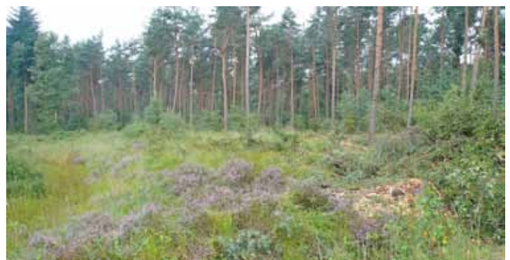
Door sparren te kappen krijgt de heide weer nieuwe kansen.

Natuur onder druk Ondanks alle beheersinspanningen in het verleden staat de natuurkwaliteit nog steeds erg onder druk. De depositie (neerslag) van onder andere stikstof door de jarenlange hoge uitstoot afkomstig uit de landbouw, maar ook uit verkeer en industrie, zorgt nog steeds voor een sterke verzuring en vermist. De problemen die hiermee samenhangen worden door het rijk en de provincie onderkend. Met geld afkomstig uit de PAS (Programmatieke Aanpak Stikstof), een overheidsprogramma gericht op het terugdringen van (de effecten) van stikstof in onder andere de natuur, kan Het Limburgs Landschap in