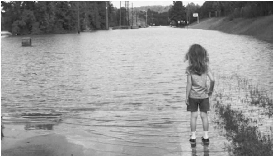
Ondergelopen straten zorgen voor veel wateroverlast. Ook in onze gemeente moeten we samen nadenken over maatregelen.