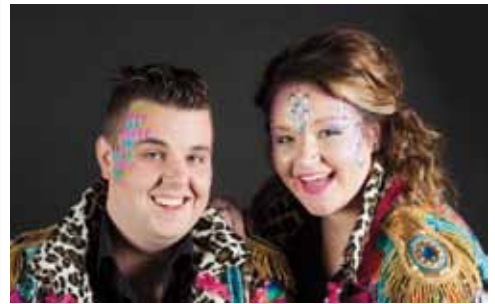
Winnar van vorige jaar DZN

Voor de 25e keer wordt in Nederweert tijdens het lidjeskonkoer de Ni-jwieërter Vastelaovundj schlager gekozen.