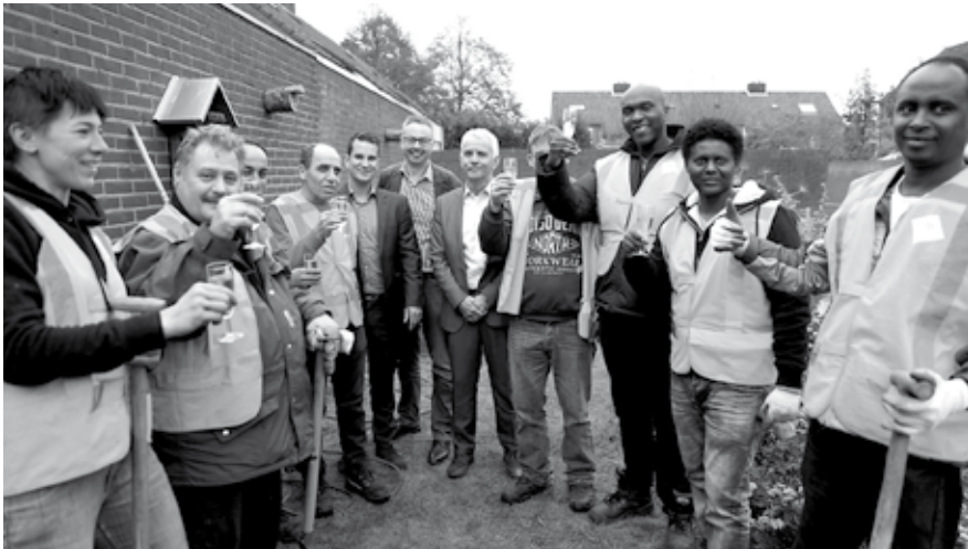
Er werd een toast uitgebracht op de start van het project door de kandidaten en de drie wethouders.