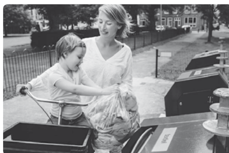
Ook versleten kleren mogen in de kledingkak!

als hij in werkelijkheid pas voor twee derde vol zit. De machine goed vol doen spaart op twee manieren het milieu. Ten eerste draai je zo op jaarbasis minder wasjes, waardoor je energiegebruik en CO2-uitstoot vermijdt. Ten tweede is er in een volle wasmachine minder wrijving tussen de kledingstukken, waardoor ze minder slijten. Nog een tip: doe