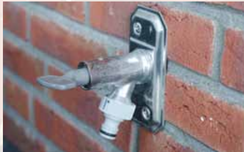
Het water van speciale 'vorstbeveiligde' kranen hoeft je niet af te sluiten.

Met eenvoudige maatregelen, maak je het jezelf een stuk eenvoudiger. Heb je een oudere woning, bescherm dan de waterleidingen, zowel binnen als buiten, tegen vorst. Dit kan met een vorstbeveiligingskabel, polyethyleenschuim, glaswol of zelfklevend schuimband. Zet in ruimten waar het koud kan worden de radiatorknop op de vorstbeveiligingsstand, herkenbaar aan een sterretje. Zo voorkom je dat het in die ruimte gaat vriezen. Je mag niet vergeten de buitenkranen af te sluiten. Soms zit de aansluiting in de meterkast, soms moet je de kruipruimte in. Maar als je de kraan niet afsluit, kan deze kapotvriezen omdat water bij vorst uitzet. Vergeet niet dat je het water aftapt. Dus als je de 'hoofdkraan' binnen hebt dichtgedraaid, moet je de kraan buiten nog even laten leeglopen. Dan is het water er zeker uit. Overigens moet je ook eventuele regentonnen laten leeglopen. Anders knapt het hout kapot als het water bevriest.