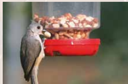
Er zijn handige hulpmiddeltjes die het vogels in de winter makkelijker maken.

De insecten zijn doodgegaan of houden een winterslaap. Als vogel moet je daar iets op vinden. Wil je de vogels een handje helpen in de winter, dan kun je verschillende dingen doen. Het is goed om op bepaalde plekken voer te strooien, op zowel de grond als op een voedertafel. Tip: hang verschillende mezenbollen en pindanetjes op. Zo voorkom je dat de vogels elkaar in de 'haren' vliegen. Wil je voer strooien, doe dat dan op een open plek. Vogels houden namelijk graag alles in de gaten. Daarom kiezen veel mensen voor een voedertafel. Welk voer? Blijf zo dicht mogelijk bij de natuur en kies bijvoorbeeld voor rozijntjes, stukjes brood, gekookte aardappels, rijst, appels en appelschillen. Je kunt ook in de dierenzaak speciaal voer voor insectenetende vogels kopen, die je bijvoorbeeld in handige voersystemen aan de dieren geeft. Mogelijkheden genoeg om de vogels de winter door te helpen!