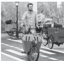
Een bakfiets? Test er eenje op 't speciaal aangelegde Babboe Bakfiets Parcours!

Verwacht je een kindje of is je baby net geboren? Kom dan van 21 t/m 25 februari langs op de Negenmaandenbeurs in RAI Amsterdam. Shop er in één dag je hele babyuitlet bij elkaar, laat je informeren door afhankelijke deskundigen, profiteer van scherpe beursaanbiedingen én laat je inspireren door de meest schattige geboortekaartjes en trendy babykamers.