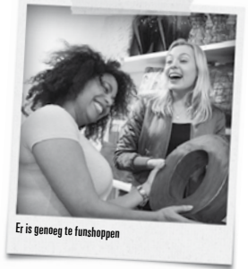
Er is genoeg te funshoppen