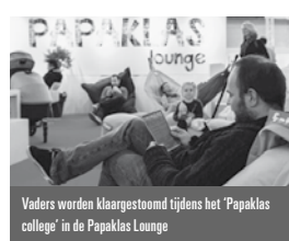
Vaders worden klaargestoomd tijdens het 'Papaklas college' in de Papaklas Lounge

Ge vuld met leuke (baby) producten. Bestel 'm in de voorverkoop voor slechts € 3,50 of koop de shopper op de beurs.