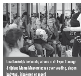
Onafhankelijk deskundig advies in de Expert Lounge & tijdens Mama Masterclasses over voeding, slapen, babytaal, inbakeren en meer!