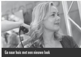
Ga naar huis met een nieuwe look