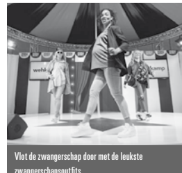
Viet de zwangerschap door met de leukste zwangerschapsoutfits