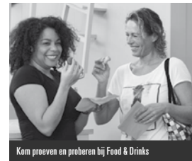
Kom proeven en proberen bij Food & Drinks