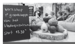
Workshop 't groentehopje van het Voedingscentrum Start 13.30