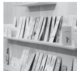
Klassiek, stoer of helemaal anders dan anders? Volop inspiratie in de Geboortekaartjes Straat