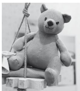
De leukste hebbedingen bij Hip & Happening, Baby Shopping Plaza & Webshop Straat