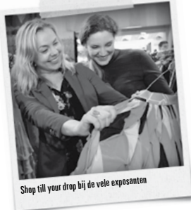
Shop till your drop bij de vele exposanten