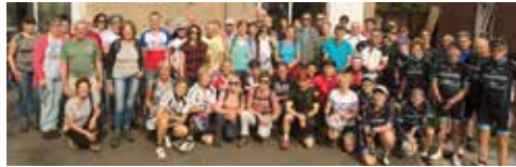
Groepsfoto van de deelnemers aan de Jan Caristoct 2018

Ook dit jaar is er weer een groep enthousiaste fietsers en wandelaars die onder de naam Toons Toppers 2018 op 30 en 31 augustus de beruchte Mont Ventoux gaan beklimmen. Te voet of met de fiets. Ook een team van het SJG Weert is dit jaar actief aan het trainen voor de beklimming van de Mont Ventoux. Beide teams ondersteunen door deelname onderzoek naar kanker en voor een deel ook de activiteiten van het Toon Hermans Huis Weert.