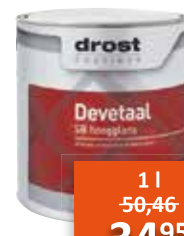
Drost Devetaal SB hoogglans