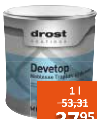
Drost Devetop Traplak