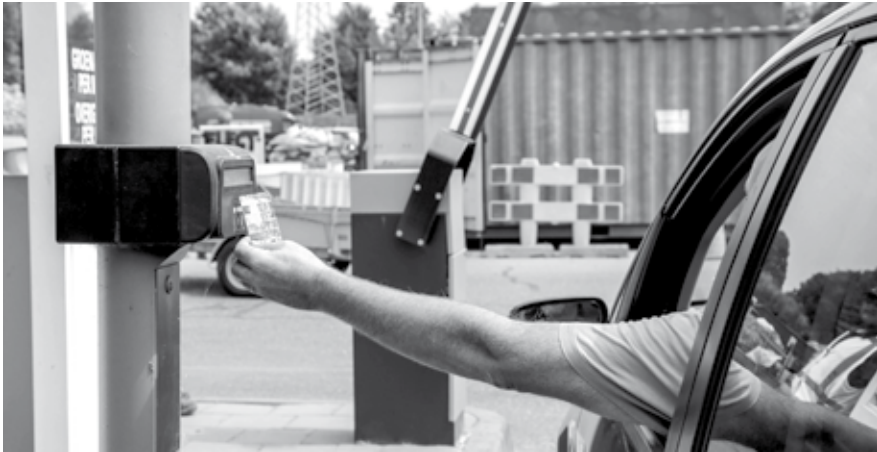
Wilt u afval aanbieden op de milieustraat? Zorg dat u uw Weerterlandpas en een legitimatiebewijs kunt laten zien.