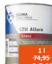
Sigma S2U Allure Gloss