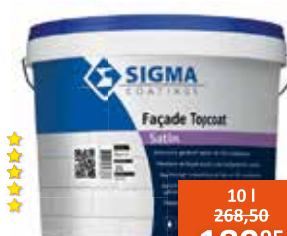
Sigma Façade Topcoat