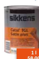
Sikkens Cetol TGL Satin plus