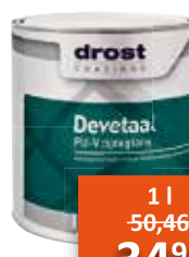
Drost Devetaal PU-V zijdeglans