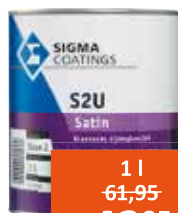
Sigma S2U Satin