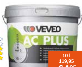
Veveo Collix AC plus