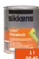
Sikkens Cetol Novatech