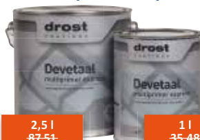
Drost Devetaal multiprimer express