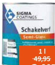
Sigma Schakelverf semi-gloss