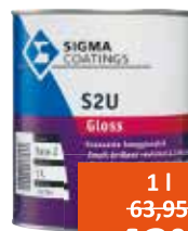
Sigma S2U Gloss