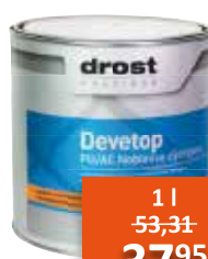
Devetop PU/AC Noblesse