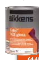
Sikkens Cetol TGX gloss