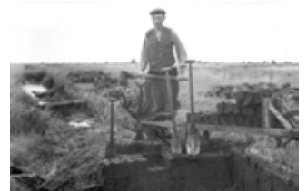
Een Oespelse turfsterker demonstreert zijn gereedschappen. omstreeks 1950.

Naarmate de bevolking groeide en de peelvelden slonken, leidde ook hier de schaarste van natuurlijke hulpbronnen tot oplopende conflicten. Regelmatig bestreden de Weertenaren en Nederweertenaren elkaars gebruiksrechten. In de zomer van 1745 kwam het zelfs tot een gewapend conflict. Met veel bravoure, wapengekletter en geschreeuw annexerden de Weerter schutterijen de Nederweerder gemene gronden van de Laerder Heijde. Het bleek tevergeefs, maar de toon was weer gezet. Turfstekers waren soms toch wel echte onruststokers. Tot ver in de negentiende eeuw sleepte dit dossier voort.