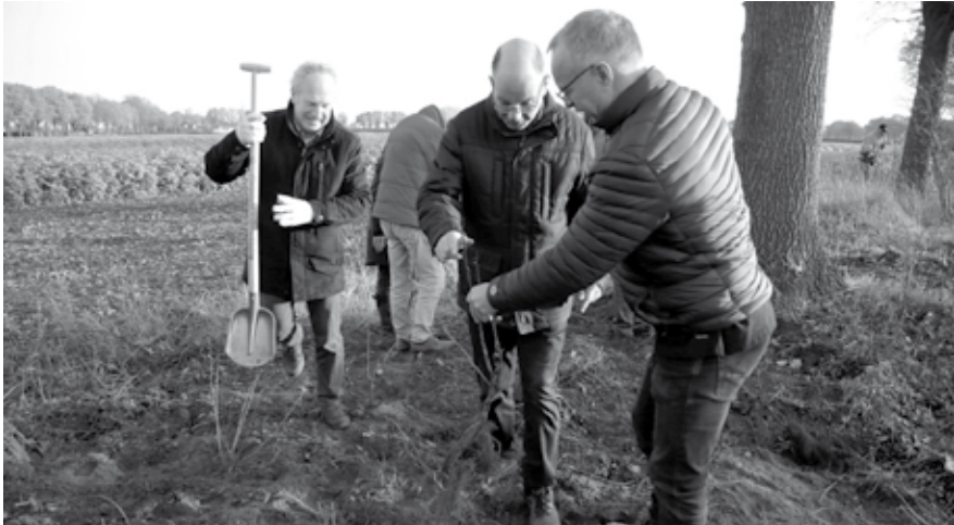
De aanwezigen gingen na de ondertekening aan de slag met het aanplanten van stekelstruwelen.