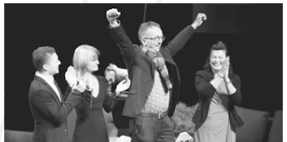
In 2018 werd de Weerterlandprijs gewonnen door kraan-, transport- en bergingsbedrijf Herpertz uit Nederweert.

Twee interessante nieuwtjes voor Nederweert ondernemers. Het college van B&W heeft besloten om vanaf 2020 een structurele bijdrage te doen voor de organisatie van de Weerterlandprijs. Vorig jaar was Herpertz Kraanverhuur Transport & Berging uit Nederweert de winnaar. Een ander project is Business Roadmaps. De gemeente biedt dit strategisch programma voor bedrijven samen met Keyport2020 aan. Door een subsidie is het mogelijk om tegen een lager tarief mee te doen.