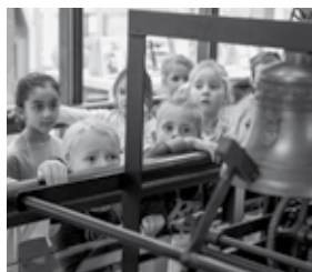
Aandachtig luisterend...