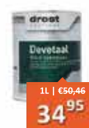
Drost Devetaal PU-V