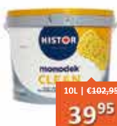
Histor Monodek Clean