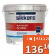
Sikkens Alphatex IQ Mat