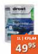
Drost Devetaal Supreme Hoogglanslak