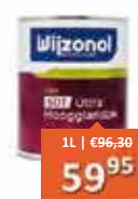
Wijzonol LBH SDT Ultra Hoogglanslak