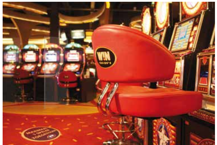
Zittend spelen op anderhalve meter afstand

Extra maatregelen "Een van de maatregelen is dat onze gasten zittend spelen. De beschikbare speelplaatsen worden gemarkeerd door stoelen voor de speelautomaten. Op deze manier kunnen er nooit teveel bezoekers binnen zijn," vertelt Sylvia. "Bij binnenkomst staan