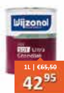
Wijzonol LBH SDT Ultra Grondlak