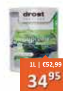
Drost Devetaal Supreme Grondlak