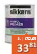
Sikkens Rubbol Primer