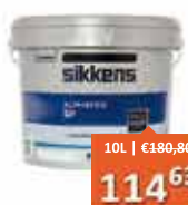
Sikkens Alphatex SF