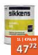
Sikkens Rubbol SB