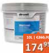
Drost Wallcoat PU/AC