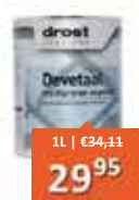
Drost Devetaal Multiprimer Express