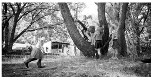
NatuurAvontuur, toffe zomer workshops voor kinderen

In de zomervakantie organiseert Natuur- en Milieucentrum (NMC) De IJzeren Man spannende kinderworkshops in Weert. Vanaf 13 juli kunnen kinderen van 4 tot en met 11 jaar meedoen met NatuurAvontuur. Op een speelse manier ervaren en beleven kinderen de natuur en leren ze over alles wat er groeit en bloeit. Ondertussen ervaren ze zelf waarom het zo belangrijk is dat dit behouden blijft. Zeker nu veel vakantieplannen zijn afgezegd, is er niets leuker dan met leeftijdsgenootjes op ontdekkingstocht in de Weertse wildernis!