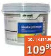
Drost Alaska Premium