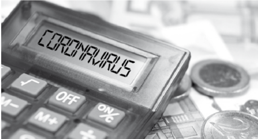
De coronacrisis brengt het besef van reflectie dichterbij. Moeten we bijvoorbeeld zaken aanpassen die in het verleden normaal waren?