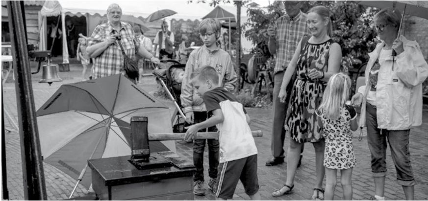
Nederweert kan bruisen van activiteiten, zoals hier tijdens de nostalgische kermis bij Eynderhoof in augustus vorig jaar.