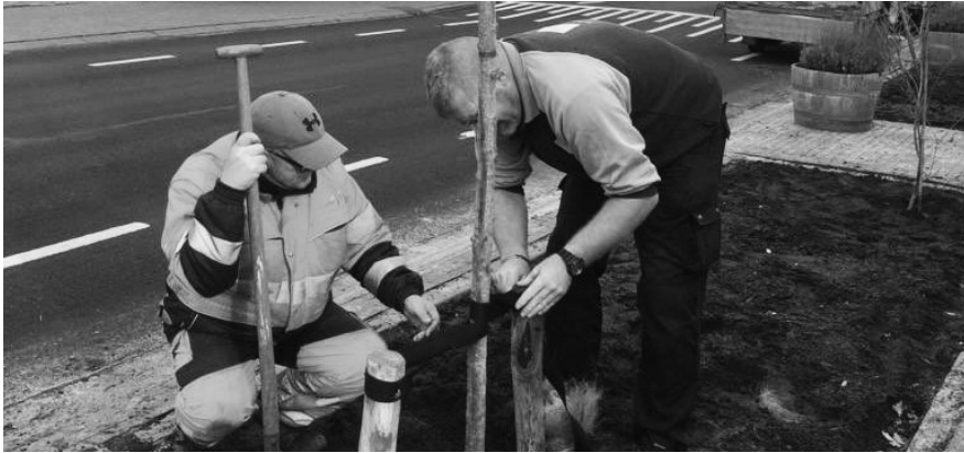
Geen auto's meer op deze plek aan de Onze Lieve Straat. Hier staan nu bomen, struiken en planten.