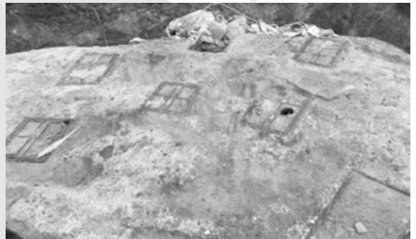
De aspergeversperring uit 1936 bij Brug 1.

Een militaire palenhindernis die is gevonden tijdens werkzaamheden bij Brug 1 in Hulsen heeft historische waarde. Dat blijkt uit de resultaten van een onderzoek door een gespecialiseerd bureau.