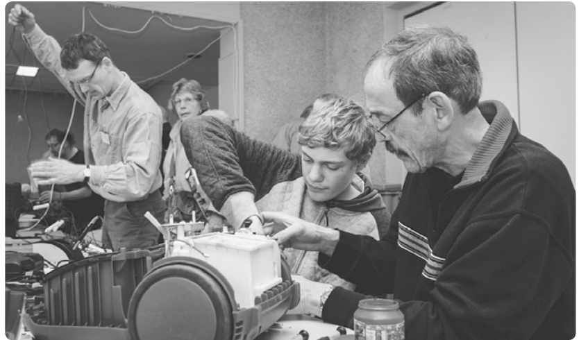
Tekst en foto: Stichting Repair Café

Niet meer te redden? Lever je gesnevelde apparaat in bij een inleverpunt voor elektrische apparaten. Deze vind je bij diverse winkels of in de milieustraat. Zo kunnen veel materialen gerecycled worden. Kapotte kleding, schoenen of ander textiel gooi je in de textielcontainer. Grote spullen, zoals meubels, breng je naar de milieustraat.