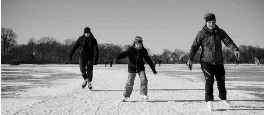
Veel schaatsplezier op Sarsven en de Banen.