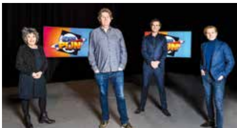
Kiespijn een allesbepalende verkiezingsquiz met Diederik Ebbinge

Uitzending: zondag 21, 28 februari, 7 en 14 maart om 20.25 uur bij de NTR op NPO 3. Kiespijn sleurt je door de verkiezingscampagnes met een opvallend gezelschap: Diederik Ebbinge, Rutger Castricum, Hanneke Groenteman en Gijs Rademaker.