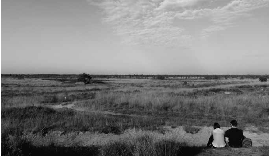
Nationaal Park De Grootte Peel maakt deel uit van NOVI-gebied De Peel.