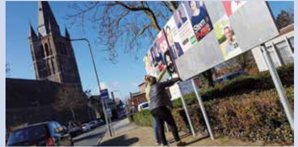
De verkiezingsborden zijn al gedeeltelijk beplakt met posters van de politieke partijen.

Heeft u uw stem(plus)pas op woensdag 3 maart niet ontvangen? Of bent u uw stem(plus)pas kwijt, of is die beschadigd? Dan kunt u een nieuwe pas aanvragen. Dit kan schriftelijk of persoonlijk op afspraak in het gemeentehuis. U kunt uw aanvraag doen tot vrijdag 12 maart 17.00 uur.