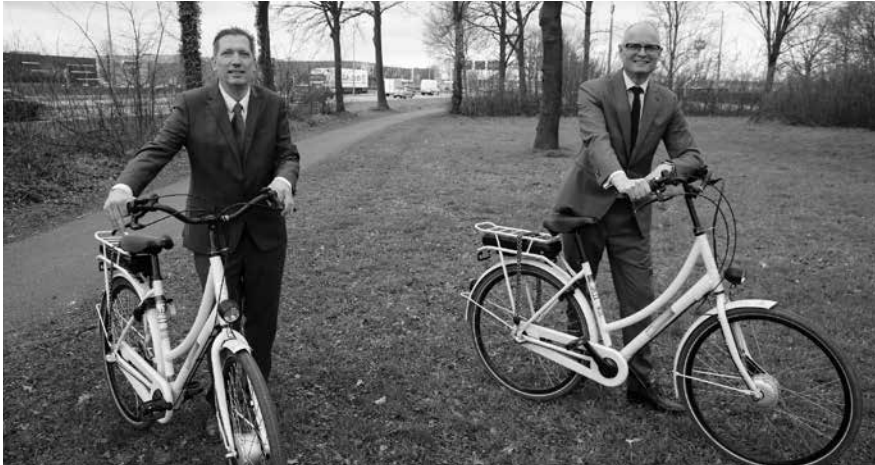
Wethouder Koolen en gedeputeerde Mackus bezochten na de ondertekening een deel van het projectgebied met de fiets.