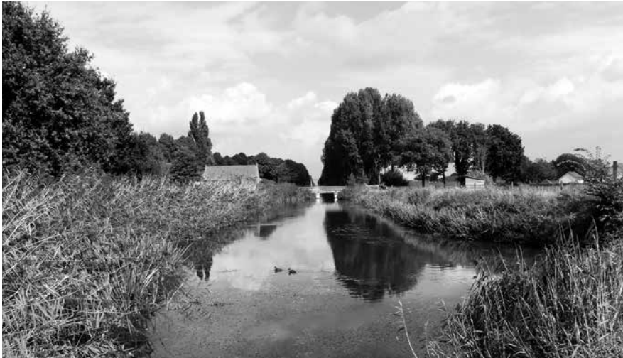
Er staan de komende jaren diverse veranderingen in het landelijk gebied van Nederweert op stapel.