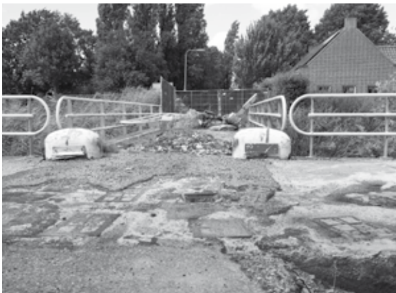
De aspergestelling (op de voorgrond zichtbaar) bij Brug Hulsen blijft behouden voor de toekomst.

Nieuwe brug Brug Hulsen is aan vervanging toe. De constructie is verouderd en kan momenteel alleen lichte voertuigen dragen. Daarom wordt de oude brug gesloopt en komt er een nieuwe brug. De nieuwe brug heeft dezelfde bouwstijl en past daarmee goed in de omgeving. De nieuwe brug is breder en sterker waardoor de huidige gewichtsbeperking van 3,5 ton niet meer van toepassing is.