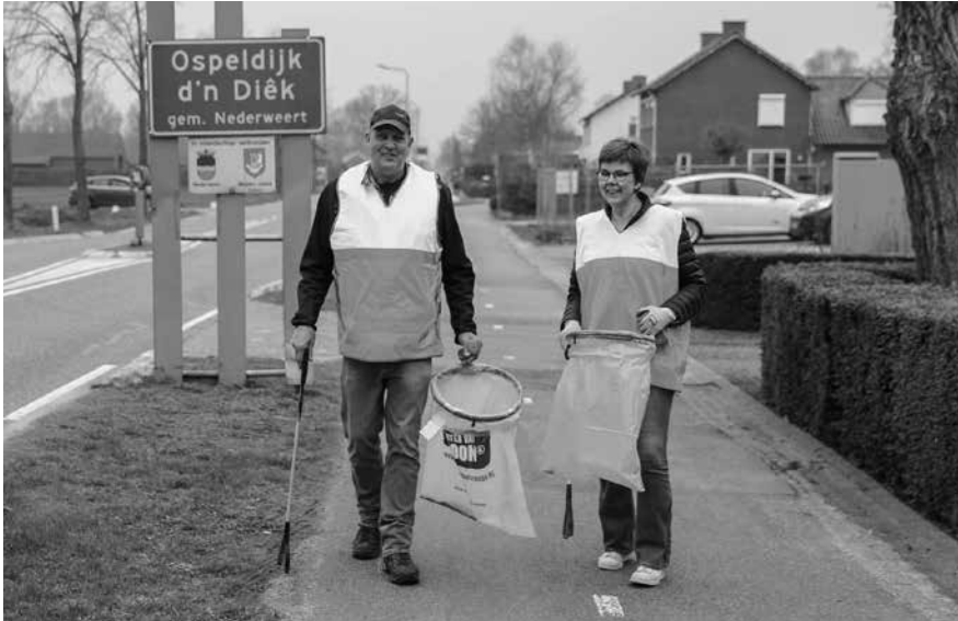
Maak onze gemeente ook iets schoner, geef je op voor de World Cleanup Day.