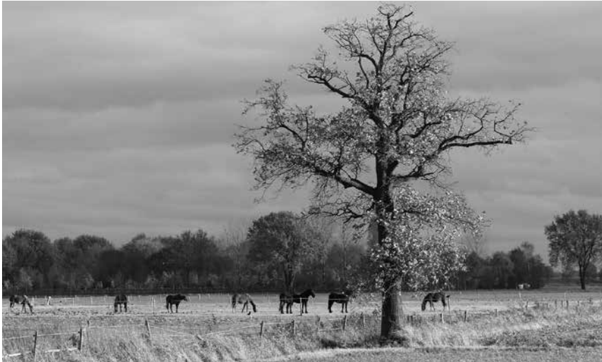
Nederweert heeft prachtige natuurgebieden met heel veel bomen en andere landschapselementen.