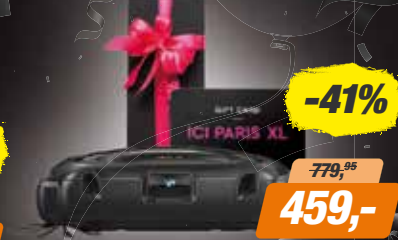
AEG ROBOTSTOFZUIGER RX9-2-4STN

• 3D Vision • EG Wellbeing app • Reservoir inhoud van 0,7 liter * Met €100,- ICI Paris XL gift card