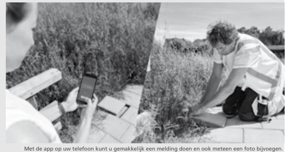
Met de app op uw telefoon kunt u gemakkelijk een melding doen en ook meteen een foto bijvoegen.

Melden gaat snel en gemakkelijk. U kunt nederweert.nl/melden gebruiken. Of u installeert de Fixi-app op uw smartphone of tablet. U vindt de Fixi-app in de App store (voor Apple) of in Google Play (voor Android).