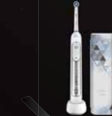
ORAL-B TANDBORSTEL GENIUS 8500W-TRAVEL CASE

• 10.1 Inch • 4 Gb geheugen • 64 Gb opslag • Full HD • Android 10