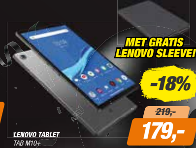
LENOVO TABLET TAB M10+