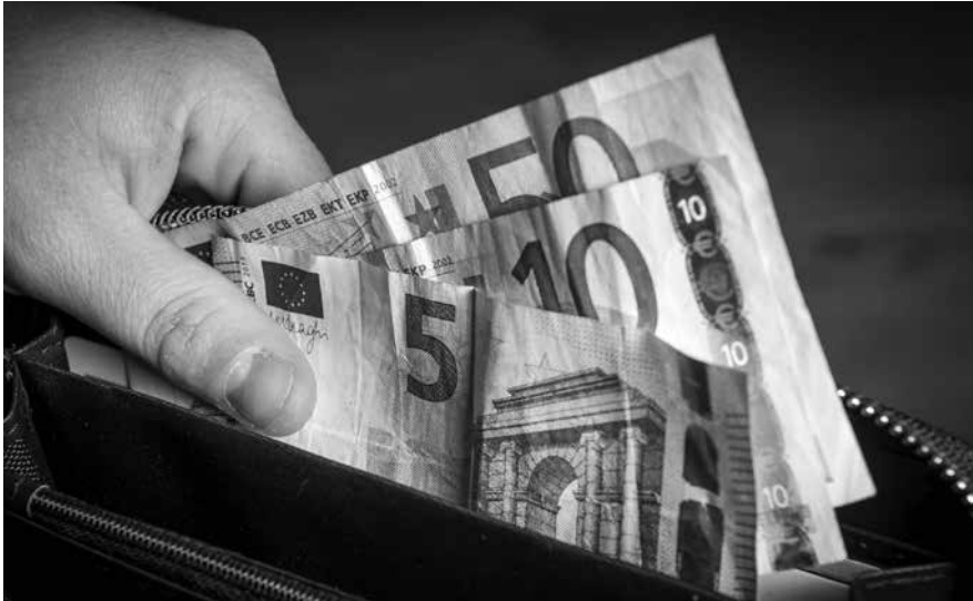
Wat gebeurt er volgend jaar met uw geld? Bekijk het filmpje Begroting in Enkele Minuten (BIEM) waarin burgemeester en wethouders een aantal projecten toelichten.