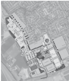
Het ontwikkelingsperspectief voor Bengel Bewegt gaat uit van een omgeving waar sport, spel, bewegen, onderwijs en ontspanning met elkaar verbonden zijn.