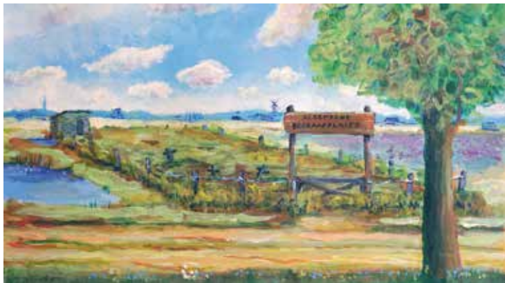
Artist's impression van het Andersdenkendenkerkhof aan de Schoordijk. Acryl op papier, Jan van Riet (2021).

kerkhof. Vervaardigd uit 'tweeduims eikenhout' en voorzien van hang- en sluitwerk van smid Mathijs Hermans. De reeds genoemde Begraafwet 1869 schrijft voor dat de begraafkosten van (aan zee, of in dit geval in een waterweg) aangespoelde lijken gedekt moeten worden uit de daar- bij gevonden goederen of gelden, en voorzover dat te weinig is ten laste van de gemeente zullen komen. In het geval van Ridder wordt in zijn kleren slechts 37% cent gevonden, en een bedrag dat natuurlijk volledig ontoereikend is voor een begrafenis. Het is dus wel duidelijk wie daarvoor de beurs moet trekken: dat is het gemeentebestuur van Nederweert.