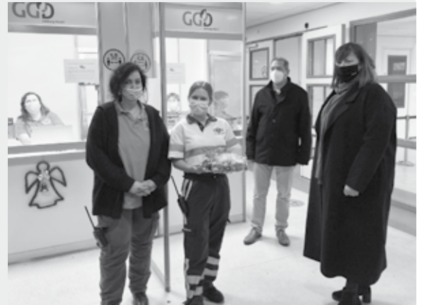
De burgemeester en wethouder Koolen op bezoek bij de medewerkers van de teststraat.

Burgemeester Op de Laak: "Waar we in de eerste coronagolf nog applaudiseren voor de zorg, lijkt de waardering voor de mensen in onze samenleving die ons zorg bieden en voor onze veiligheid waken, enigszins af te nemen. En ook de jeugd, die vanwege de beperkende