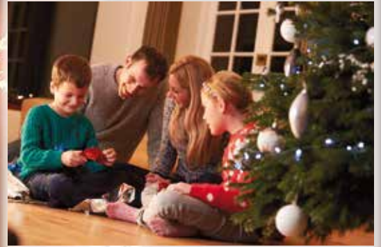
De kerstboom zorgt voor veel gezelligheid in huis.

Over het gebruik van de spar als kerstboom zijn veel verhalen in omloop. Algemeen is de theorie dat het gebruik haar oorsprong vindt in de 'boomcultus' van de oude Germanen. Zij vereerden bomen en de spar nam daarbij een bijzondere plaats in omdat deze boom het hele jaar door groen blijft. Dat moest wel bijzonder zijn, zo werd gedacht. Het gebruik van de kerstboom met Kerstmis stamt uit Duitsland. In Nederland zijn we er een paar eeuwen geleden pas mee begonnen.