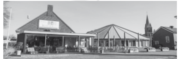
Brasserie Vrienden van de Peel