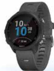
GARMIN HARDLOOPHORLOGE FORERUNNER 245 ZWART GRUIS

• Ingebouwde GPS • Ingebouwde sport-apps • Geavanceerde trainingsfuncties • Tot 7 dagen batterijduur • Geschikt voor Android en iPhone