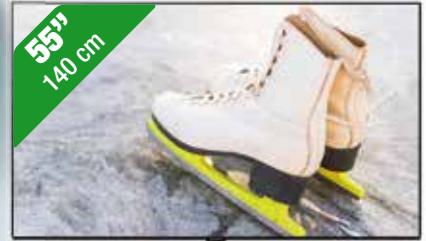
PANASONIC OLED TV TX-55JZ984

• OLED • 4K Ultra HD • 100hz dus ideaal voor razendsnelle sportbeelden! • HCX Pro AI-processor • Cinema Surround Pro