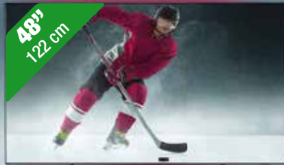
PHILIPS OLED AMBLIGHT TV 48OLED80612

• OLED • 4K Ultra HD • 4-Zijdig Ambilight • 100hz dus ideaal voor razendsnelle sportbeelden! • PS AI Perfect Picture Engine