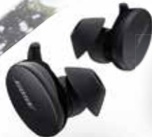
BOSE SPORT EARBUDS SPORT EARBUDS

• Zweet- en weerbestendig • Tot 5 uur batterijduur • Touchbediening • Levensecht geluid • Met handige oplaadcase • Ook verkrijgbaar in wit