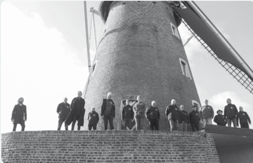
Zonder de vrijwilligers van Molenstichting Nederweert kunnen onze drie gemeentelijke molens niet draaien.