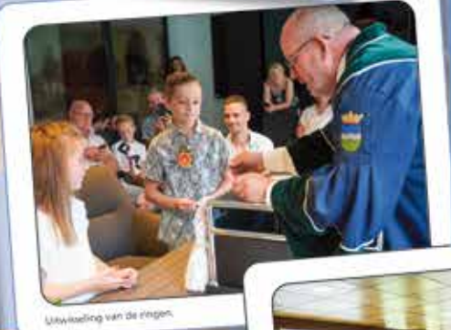
Uitwisseling van de ringen.