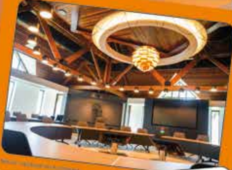
Nieuw licht voor de kantine