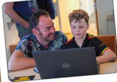
Een online competitie spelen