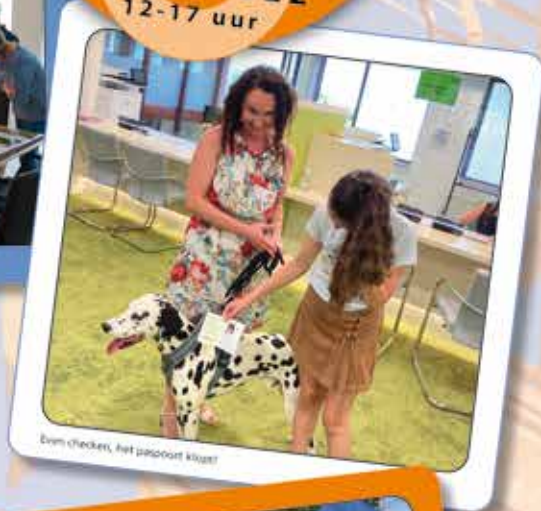
Zem checker, het paspoort kloost!