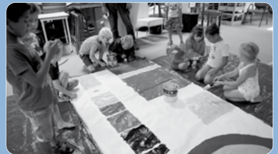
Er wordt hard gewerkt aan het beschilderen van de zeilen.

De resultaten van de schilderssessie zijn te zien in september. Dan wordt het jubileum van molen De Windlust gevierd met een aantal activiteiten, waaronder het hijsen van de speciale Mondriaanzeilen. Coördinator namens de molenaars, Peter Kneepkens, belooft dat het een mooi feest gaat worden, "uiteraard met de jubilerende molen als middelpunt".