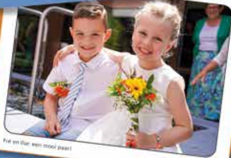
Fé en Iar, een mooi paar!