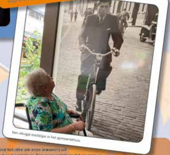
Een vliegende voorlezer in het gemeentehuis.