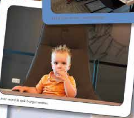
Later word ik ook burgemeester.