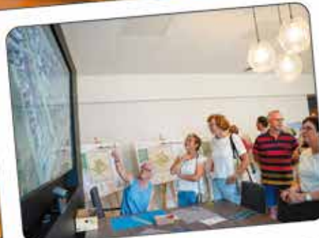
Kijk, daar ligt mijn taak!