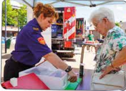
Tips van de brandweer