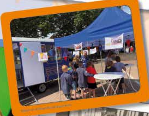
Open huis op de markt