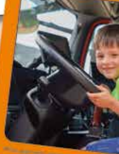
De toekomstige chauffeur