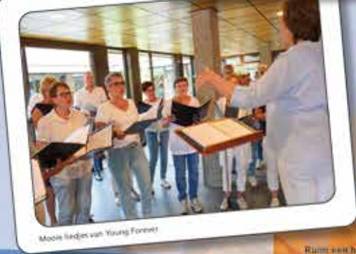
Mooie liedjes van Young Forever