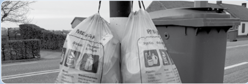
Komende dinsdag beslist de gemeenteraad of de PMD-zakken vanaf 2023 wekelijks opgehaald gaan worden.