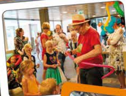
Bij met ballonnen