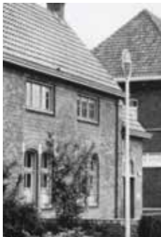
Het oude patronaatsgebouw