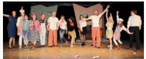
De cast van 'Een koffertje vol dromen' (2017).

Dat is echt geweldig! Lonne vult aan: "Met al de groepen spelers waarmee we samen een productie hebben gemaakt, was het heel gezellig tijdens de doorlopen en in de kleedkamers tijdens de uitvoeringen. Iedereen kan met iedereen goed overweg ondanks de leeftijdsverschillen tussen de spelers." Samen vinden ze het een machtig gevoel als het publiek geniet van de voorstelling. Ondanks alle tijd die het kost om dit bereiken. Hun tip: Toneelspele: Doe het gewoon! Geef je voor je voor workshop als de Krotteoffers deze aanbieden. Momenteel telt de club 12 jeugdleden en twee leden van net 18 jaar.