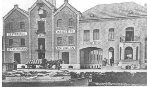
Moderne Stoom-Granzuivering van J. Hendriks-Meevis. Weert (1914)

De Weerter stadsgidsen organiseren op zondag 9 oktober de open wandeling 'Weert Wordt Wakker'. De afgelopen jaren kon deze nieuwste wandeling van de stadsgidsen over " de opkomst van Weert als industriestad" vanwege de coronamaatregelen geen doorgang vinden. Deze thema-wandeling wordt, net als bij de Van Horne Wandeling uit 2018, ingeleid door een informatiefilmpje over de industriële ontwikkeling van Weert door de jaren heen.