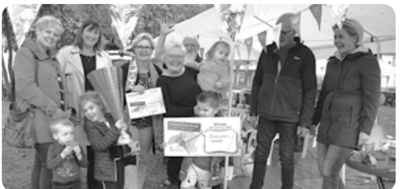
Gewonnen! Blijde gezichten bij de uitreiking van de beker en de waardebon.

We feliciteren alle bewoners van de Esdoornstraat van harte met deze titel!