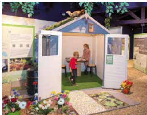
Kinderen kunnen zelf de gevolgen van een veranderend klimaat aanpakken in dit duurzaamheidshuisje in Museum Klok & Peel

De gemeenten Asten en Someren, waterschap Aa en Maas, Stichting CuVoSA, IVN Asten-Someren en Museum Klok & Peel zetten in het aanstaande schooljaar samen een ambitieuze duurzaamheidscampagne op.