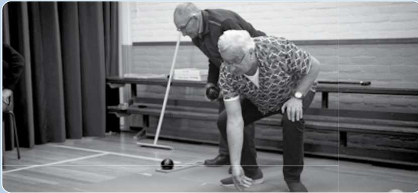
Positieve gezondheid is één van de drie majeure programma's. Gelijke kansen op gezondheid voor iedereen door een samenhangende aanpak van welzijn, cultuur, sport en zorg.