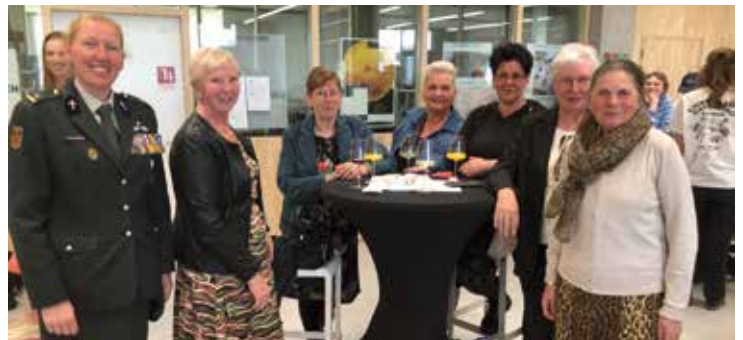
Leden van de familie Van Grimbergen tijdens de ceremonie.

Gedeporteerd Vlak voor de bevrijding door de geallieerden in het voorjaar van 1945 hebben de nazi's alle op dat moment nog levende gevangenen uit concentratiekamp Neuengamme weggevoerd. In het zicht van de bevrijding gingen zij