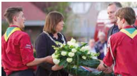
Kranslegging door de Burgemeester.

Traditioneel werd op 4 mei de Dodenherdenking gehouden op het Raadhuisplein in Nederweert. De belangstelling was groot en dat geeft aan dat we het nog steeds een belangrijk moment vinden.