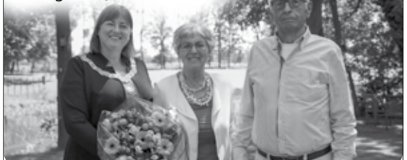
Het diamanten paar samen met de burgemeester.